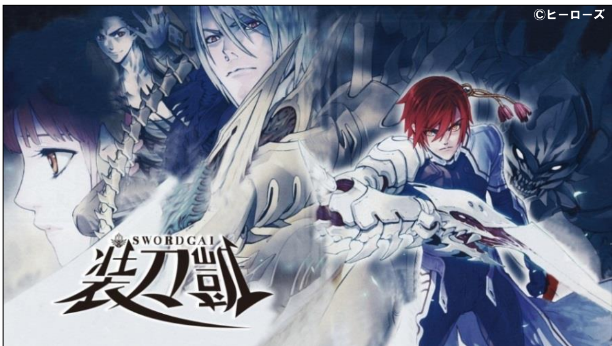
▲ 月刊「ヒーローズ」連載の『ソードガイ 装刀凱』イメージイラスト

本プロジェクトにおいて、両社の持つノウハウやネットワークを最大限に活用し、アニメコンテンツ開発に推進していきます。さらに今後は、共同開発したアニメコンテンツをもとに、国内・海外における映像展開に加え、ゲーム分野やマーチャндаイジング分野等、幅広いエンタテインメント領域へ取り組みを拡大していく予定です。