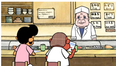
《USA 編#2「SUSHI-BAR にて」》