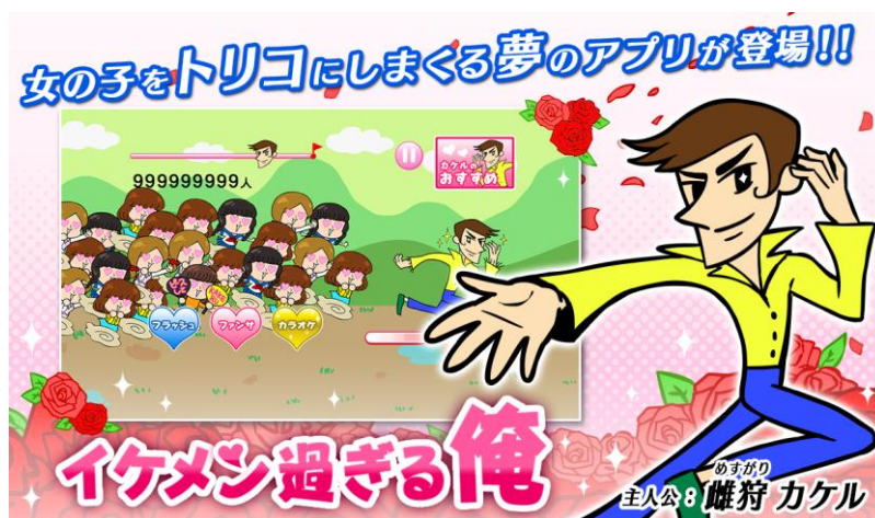
【ゲームアプリ第一弾「イケメン過ぎる俺」の概要】

株式会社ディー・エル・イー（本社：東京都千代田区、代表取締役：椎木隆太、以下「DLE」）は、オリジナルIP「イケメン過ぎる俺」を新規開発し、当該IPを活用した新感覚スピード調整アクションゲーム※アプリ「イケメン過ぎる俺」を株式会社リディンク（本社：東京都渋谷区、代表取締役：岡一步）と共同開発し、配信を開始いたしました。