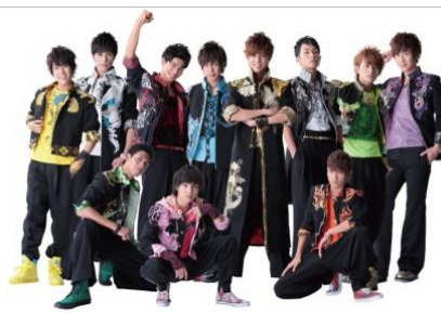
BOYS AND MEN