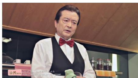
番外編「悩んでいるあなたへ」 https://youtu.be/ljw3KAvgSEM

ストーカー被害防止のためのポータルサイト： http://www.npa.go.jp/cafe-mizen