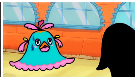
第3話「逃げることも大事！」編 https://youtu.be/G4wauh3ljhM