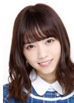
西野七瀬 (乃木坂 46)