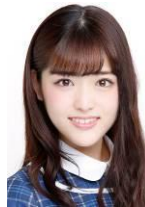
松村沙友理 (乃木坂 46)