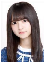
齋藤飛鳥 (乃木坂 46)