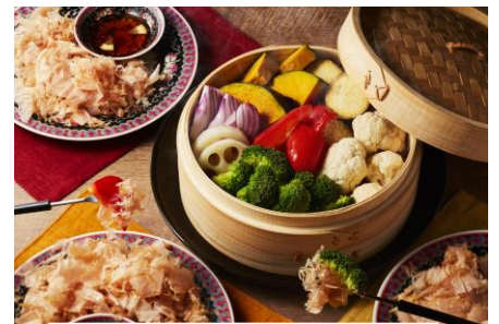
蒸し野菜の花ふわりフォンデュ