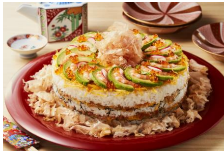
ミルフィーユちらし寿司