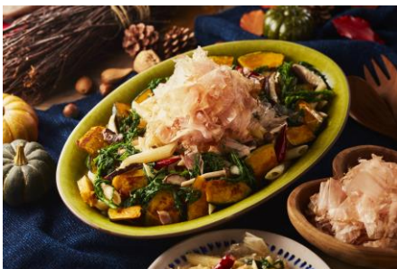
きのこのペンネサラダ